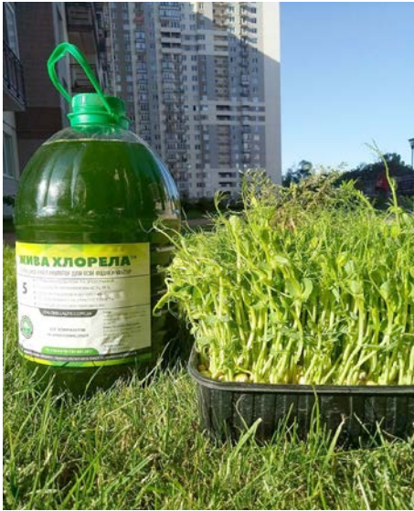
Рис. 4. Культуральне середовище хлорели містить велику кількість фізіологічно активних речовин

ношення та якість продукції, термін зберігання та транспортабельність плодів, що в цілому позначається на підвищенні врожайності.