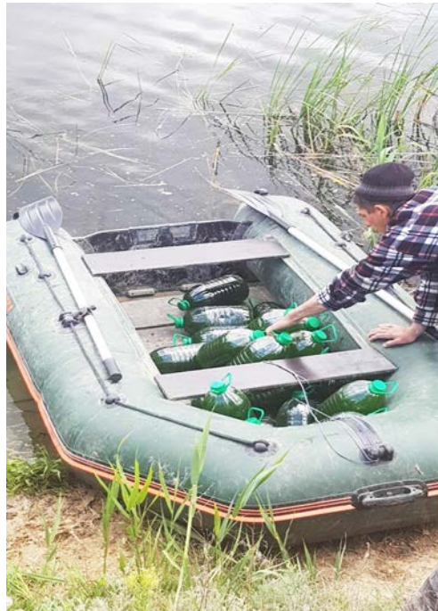
Рис. 3. Внесення суспензії хлорели у водойми

Численні дослідження, в тому числі авторів статті, виявили широкий спектр позитивних ефектів від застосування суспензії мікроводоростей у рослинництві. Під дією обробок стимулюється стійкість до біотичного та абіотичного стресу, коренеутворення, поліпшується цвітіння, плодо-