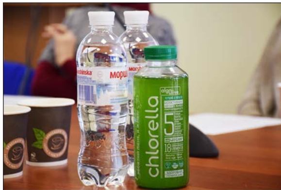
Рис. 5. Ємності з хлорелою придатною для споживання

Як продукт суспензія хлорели поставляється в рідкому вигляді, транспортується і зберігається в каністрах для харчової продукції ємністю, зручною для використання споживачем. Увесь період з моменту отримання суспензії від виробника до її споживання, хлорелу не можна заморожувати. Зберігатися каністри з суспензією хлорели повинні в приміщеннях з температурою не нижче 5°C. Придатність хлорели для підживлення рослин становить 90 днів. Однак після 14 днів з моменту її відвантаження ефективність починає знижуватися, може з'явитись осад, тому продукт необхідно збовтати перед використанням.